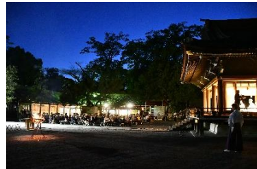
③三嶋大社 夜間公開