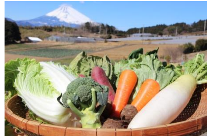
⑥箱根西麓三島野菜イメージ