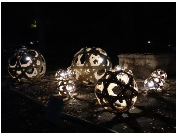
④竹あかりイメージ