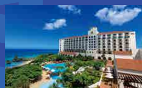
ホテル日航アリビラ