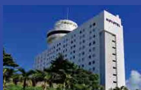
ノボテル沖縄那覇