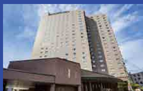
札幌エクセルホテル東急