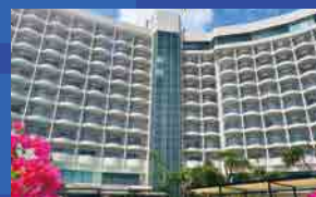
ロワジールホテル那覇