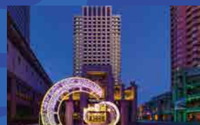
ザ パークフロント ホテルアット ユニバーサル・スタジオ・ジャパン