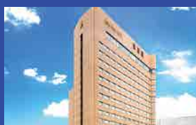
ロイヤルパークホテル