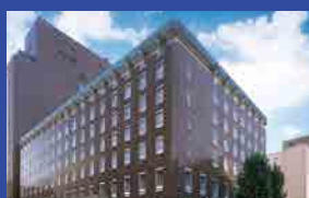
札幌グランドホテル