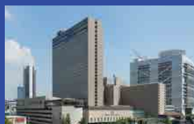
リーガロイヤルホテル