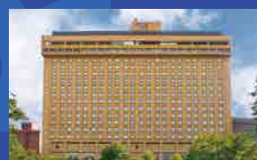
名古屋観光ホテル