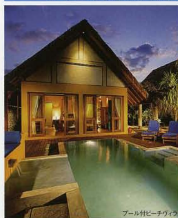
プール付ビーチヴィラ