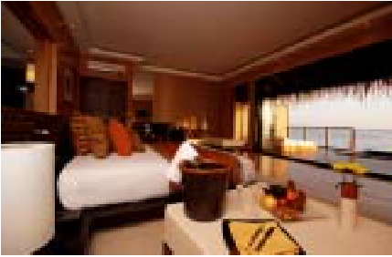
<水上バンガロー客室一例>

昨年3月にアダーラングループの5つ星リゾートとしてリニューアルオープン致しました。当リゾートは、マーレから高速艇で約15分です。すばらしいハウスリーフがすぐ近くにあるため、ダイバーに大変人気のリゾートです。この度、オール・インクルーシブと朝食付きのみの2プランをご用意させていただきました。