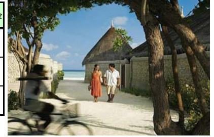
<リゾートイメージ>

●12月15日までに1月11日～3月31日の期間内でクダフラにチェックインするご予約をされた方は、クダフラご滞在中1部屋2名様まで「夕食付き」とさせていただきます。(現地出発日を除く)