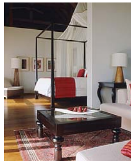
<水上ヴィラ客室一例>