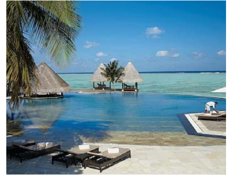
<メインプール(イメージ)>