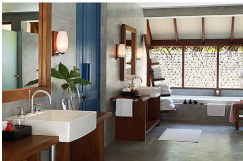
<プール付きビーチバンガロー客室一例>

モルディブでも有数の美しさを誇るラグーンでのセーリングやダイビング、スパでの本格的なアール・ユルヴェーダなど、モルディブならではのパッケージを満喫ください。