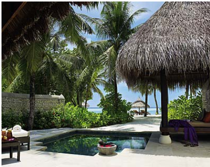
<プール付きビーチパヴィリオン客室一例>

専用アイランドにあるスパでは、心地よい秘伝のアジア式トリートメントをお楽しみいただけます。さまざまな表情を見せる広大な空の下、くつろぎのひと時をおすごください。