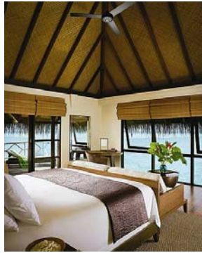
<水上ヴィラ客室一例>